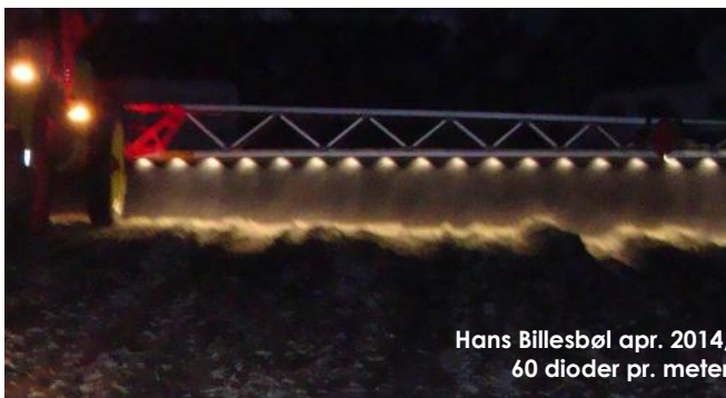
Hans Billesbøl apr. 2014, 60 dioder pr. meter

Sættet leveres klar til montage inklusiv rensesvæske og montagelim.